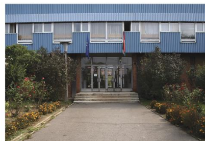
Tanműhely Martyn Ferenc utca 4.