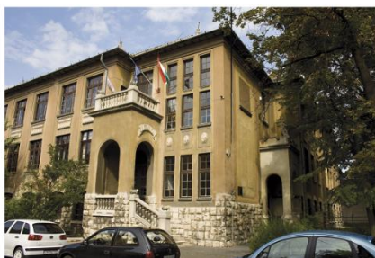
Szakiskola Petőfi utca 72.