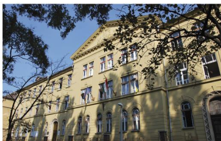
Központi épület Rét utca 41-43.